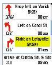
Página da próxima direção