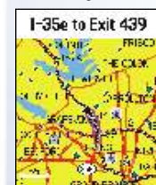
Página de mapa