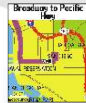
Página de mapa